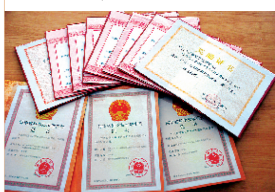
近5年来，郑州市疾控中心先后有20多项科研成果通过验收，获科技成果奖15项，其中1项被卫生部选为面向农村基层推广的“十年百项”计划项目，2项获得国家发明专利。