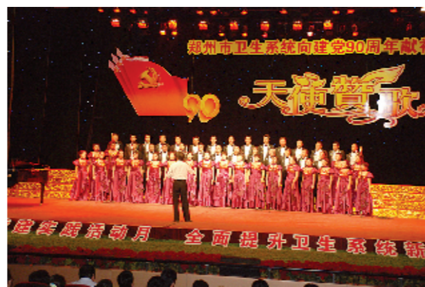
郑州市疾控中心参加“天使赞歌”比赛