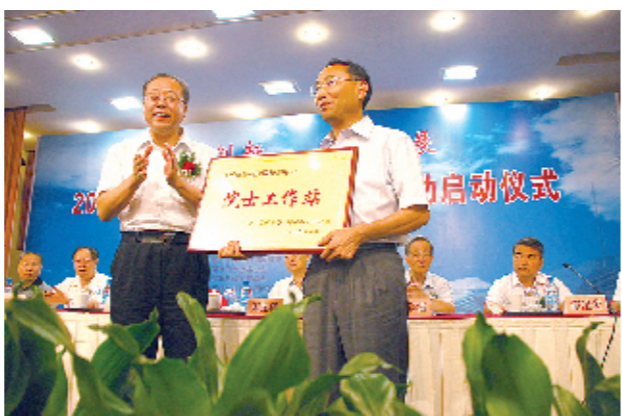
2009年院士工作站启动

一系列新举措的推出，一项项工作的助推，促进了郑州市疾病预防控制中心队伍在思想上务实、在干事上踏实、在为民上务实，培育团队的精神、意志、毅力，提升防疫技术和应急能力，以良好作风聚力量、干工作、求实效，在百姓心中树起了实干为民的“健康卫士”新形象。