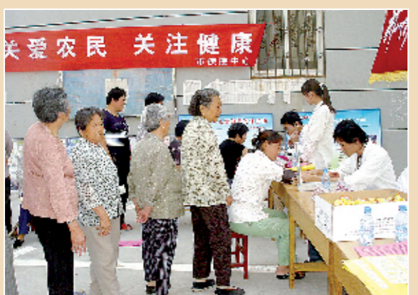
卫生服务进农村——到蔡城镇义诊

海阔凭鱼跃，天高任鸟飞。随着郑州市疾病预防控制中心正式迁入新址，豪情满怀、高歌猛进的郑州疾控人将以更加显著的业绩担负起更加光荣的责任，以更加铿锵的足音迈向更加辉煌的征程，以更加澎湃的激情抒写更加璀璨的华章！