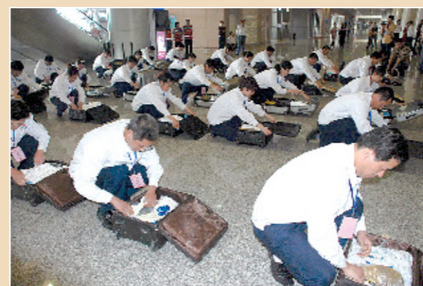
检查、整理应急物品