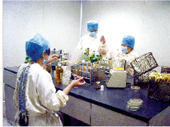
中心实验室率先在省内通过了全国最新标准的国家计量认证，图为万级无菌实验室。