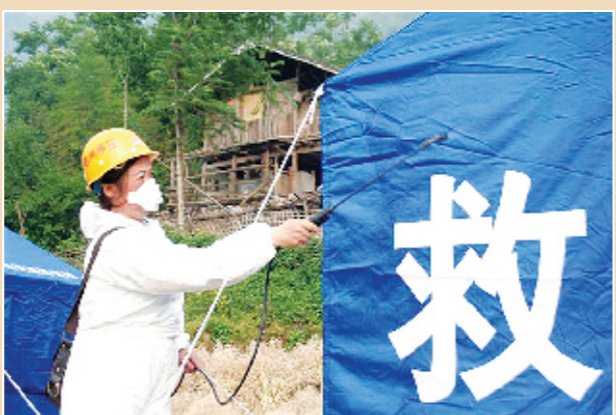
抗震救灾防疫队员正在对每一顶帐篷认真消毒