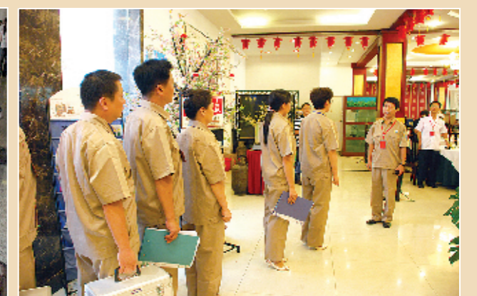
处置突发公共卫生事件